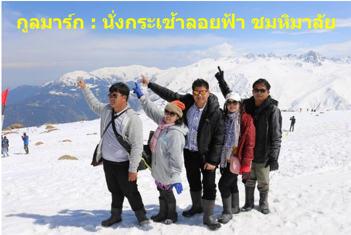
กุลมาร์ค : นั่งกระเช้าลอยฟ้า ชมทิวทัศน์