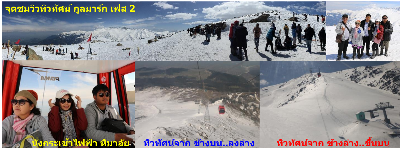
นั่งกระเช้าไฟฟ้า หิมาล้อย