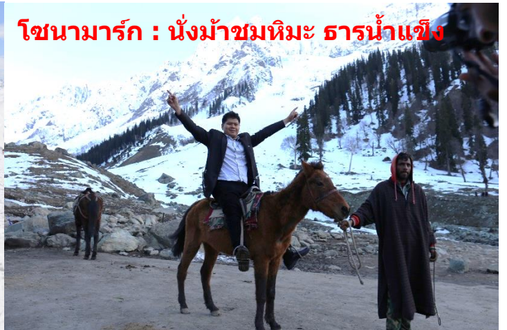
โซนามาร์ค : นั่งม้าชมทิวทัศน์ธารน้ำแข็ง