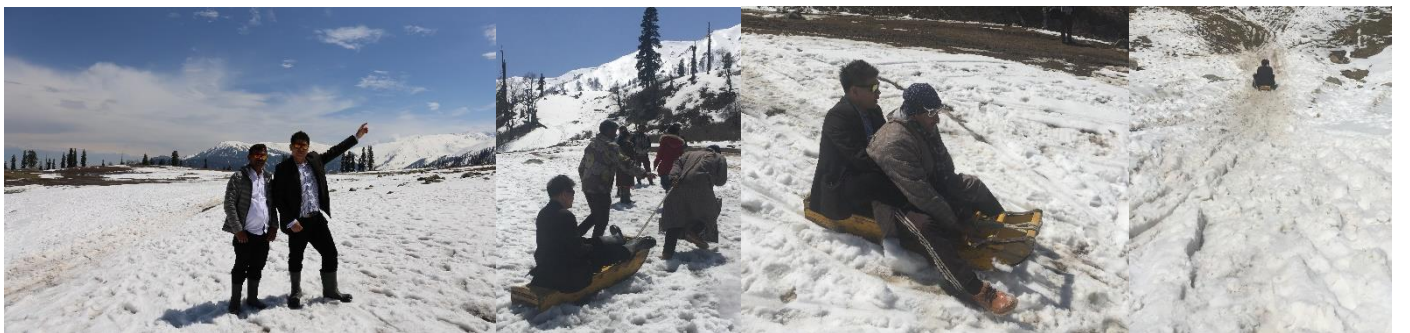
จุดชมวิวกุเขาหิมาลัย กุลมาร์ค เฟส 1

-จากนั้นเดินเท้า (หรือนั่งม้าไม่รวมค่าทัวร์ 200-400 รูปี/ประมาณ 1 กม. ) ต่ไปยังจุดที่จะขึ้นกระเช้าไฟฟ้าสู่ภูเขาหิมาลัย -นำท่านขึ้น เคเบิลคาร์ เฟส 1 (กระเช้าไฟฟ้าหรือคอนโดลา) ไปจนถึงยอดเขากุลมาร์ค ระหว่างทางขึ้นสู่ยอดเขากุลมาร์ค จะได้เห็นหมู่บ้านยิปซี ในช่วงฤดูหนาวชาวบ้านจะอพยพไปอยู่ที่เมือง จัมมู และจะกลับมาอยู่อาศัยในช่วงฤดูร้อน บนยอดเขากุลมาร์คนี้ ให้เวลาอิสระท่าน 1 ชม. ตรงเฟสที่ 1 นี้จะมีลากเลื่อน (มีคนลากจูง) และ สกี (มีคนคอยดูแล) ให้ท่านเล่นอิสระ